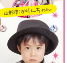
山形市:あけちゃん