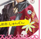
山形市:しゅんくん

★振袖いちばん館の中にあるスタジオです♪ ★ビデオ、カメラ、携帯電話での撮影はご遠慮ください。