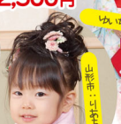
山形市:こはるちゃん