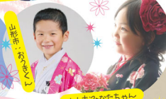
山形市:あけちゃん