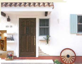
World Door Collection MERIT KITCHENS 「WDC」(米産アガ)