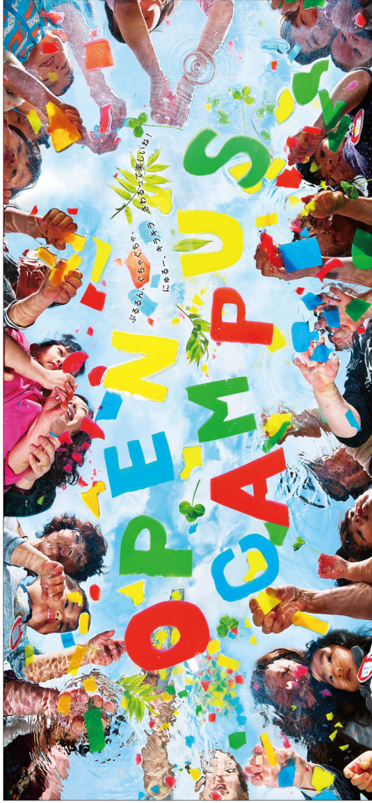
写真：オープンキャンパスイベント「もってこらん」