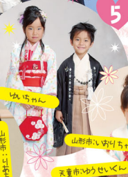
山形市:あけちゃん