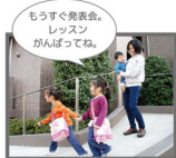
もうすぐ発表会。レッスンはがんばってね。