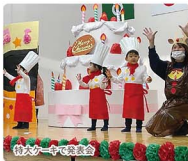
特々大一会で発表会

季節の行事の際には、かしのき保育園とかしのき子育て支援センター両方の行事に参加して同じ行事を違う内容で二度楽しんでいます。子どもたちの経験値や満足度が高いものになるように、全員が主役、一生の思い出になるように意識して取り組んでおります。未満児からの水書道も大好評です。