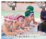
みんなでプール遊び気持ちいいな〜!

「心身ともに健康で心豊かな子どもの育成を目指して」を教育目標としています。重点教育「健康」では水泳による独自の幼児教育カリキュラムを、「自然科学」ではプログラミング教育を実践しています。子ども達が豊かな園生活を送れるよう「心も体も裸で受け止めて」ています。