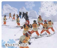
雪もスキーも大好き!

毎日が健康。毎日が笑い。毎日が好奇心。少人数だから、子どもひとり一人の個性を引き出し、すくすくのびのび「みんな大好き!」になる心を育みます。プレスクールもありますので、見学はいつでもお子さんといっしょに遊びに来ててください。お電話をお待ちしています。