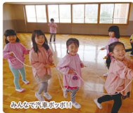
みんなでお歌を歌おう!

保育と教育を共に提供できる英語や体操、屋内プール活動等を課外活動で行い、日常の教育活動、園の細活動、行事等と併せた体験学習を通して子どもの情操を養い、豊かな感性と生きる力を育みます。また、希望者は通園しながらカワイイ体操・音楽・造形教室やECC英語教室を受けることも可能です。