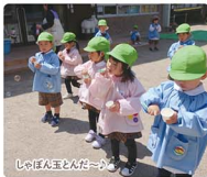
じゅん玉とんだー

「いつもえがや、やさしいことば」を合言葉に園児一人ひとりの「心の教育」を重視しています。御仏様に心守られて、いつのまにか、やさしく、つよい心を養っていきます。保護者の皆様と二人三脚で子ども達の成長を育みたいと思っています。喜びも悩みも共に一緒に、HPで、笑顔いっぱい園児たちのありのままの姿をご覧ください。