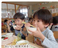
おいしい給食大好き!

東北文教大学のキャンパス内、新緑が見える緑豊かな広々とした幼稚園。より良い人との関わりで、健康で意欲あふれる心豊かな子どもに育ちます。預かり保育もあり、お母さんが安心して働ける環境も魅力の一つ。手作りの自園給食がとてもおいしいです。興味と好奇心を膨らませて「夢中」になって遊ぶことで主体性を育みます。