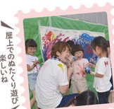
園上でのぬたくり遊び