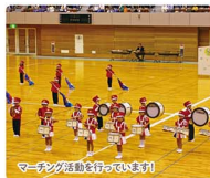
マーチング活動を行っています!

心身共に健康で誠実な子どもの育成を目指しています。広々とした園舎と園庭の中で、音楽教育と自然教育を重点目標にした保育を行っております。また、英語レッスンや希望者のバトンクラブ・体育教室があります。いつでも園の見学や子育て相談ができますので、ぜひお気軽にお問い合わせ下さい。