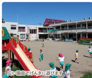
広大な園庭でぐんぐんと遊びます

幼稚園は子どもが初めて入る学校です。金井幼稚園では、夢中で遊ぶことでいろいろな興味関心を広げ、豊かな心や思いやりの気持ちを身につけることを大切にしています。また、一年中使用できる温水プールでたましい身体と強い心を、園庭や畑で自然に触れ合うことで、探究心や豊かな感性を育みます。