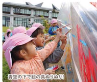
青空の下で絵の具遊び中!

ものごとを探求しようとする心=好奇心。人間形成の土台となる幼児期だからこそ、心を大切に育てます。アート&デザインの刺激いっぱいの芸術大・多様なコミュニティ・豊かな自然。これらの環境が特徴です。様々な経験を重ねながら、これからの時代を生き抜く強さ、しなやかさが育ちます。