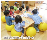
僕たちの椅子は大きなボール

ここで出会い、ここからはじまる。2歳・3歳・4歳・5歳、各年次毎の特色あるカリキュラムに基づき、年間を通して楽しい「体験学習」を積み重ねていきます。幼児期に育まれる「豊かな感情や「知的な感性」の育成をめざし、充実した生活環境を整え、身近な自然環境に積極的にアプローチ。昆虫の森創造プロジェクト。創意進行中!!