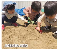
お外あそび大好き

米沢市巾着町にあるキッズヒーパルは(国)米沢総合卸売センターの近にあり、地域の方などでも入園できる保育園です。保護者の皆様の負担軽減となるよう各種割引制度の充実や便利なサービスの導入などを実施中、今まで以上にお安くご利用いただけるようになりました。また、自園直営で産産産の有機米を使用開始。お子様の健やかな成長を応援します!