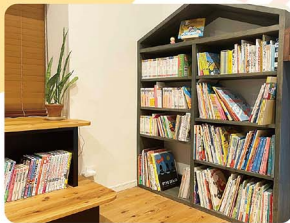
ご自宅の本棚には、様々なジャンルの本が並びます。

本棚から手に取って、自分で読んだり眺めていた記憶があります。「パーババ」「そろそろのたぬ」「ありとすいか」「きょうはなんのひび」などが大好きでした。絵を描くことと工作も好きで、いつも空き箱やチラシで何かを作っで遊んでいたかな。