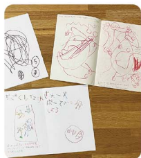
娘さんとの思い出が詰まった手づくり絵本

小さい頃は、「ベネロベ」、「ノンタン」「シロリス」、「すてきなこんぐみ」「どろぼうがっこ」などをよく読んでいました。娘自身もよくお話を作っていて、その頃の手作り絵本は今でも宝物です。