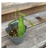
前号、娘(小2)が先生とクラスのみんなで作ったどんぐり。なんとも愛おしい! 園に植えたぞうと思えます。我が家は今年もどんぐりです。

梅雨の不調について取材をさせていただきました。私自身、梅雨の時期は絶対不調。運動や活活など試してみてもすいっと不調。先生にアドバイスをいただいた事を基に、今年こそは梅雨対策法をみつけて、雨の日の開放す「梅雨ならではの」楽しさを味わいたいです。今号のけんこうナビが、梅雨の不調に悩む皆さんの役に立つと嬉しいです。