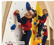
ボールラング練習

今年4月から新しい園舎で0歳児から受入可能な幼稚園として開園しました。食育を掲げ園内にランチルーム、畑での栽培、手作り給食にも力を入れてあります。環境が子ども達の成長に大切と考え、ボールゲーム、絵本コーナー、隠れ家のお家、屋上プールその他たくさんのかかげが園内にある、ワクワクする園です。