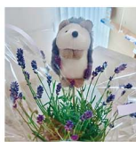
最近の我が家「ありがと」は時の日、ハリスネズミ付きのランナーももらいました。読んでくれてありがとう。そう、スポンサーの気もありがと。

アンケート会員さん、入園特集のアンケートにご協力いただきありがとうございます! 少し前に担当した「ママのストレス」特集も好評だったと聞いて、とても嬉しいです。忙しい中、アンケートや感想のために時間を割いてくださったのが本当にありがたすぎて、できるなら一人一人に感謝を伝えたいくらい。これからも皆さんに読んでよかったと思ってもらえるよう頑張ります!