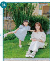
04 どんどん美しくなって、足をエディットまははこんぞうもどろろし?