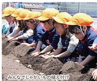
みんなでじゃがいもの植え付け

出羽小学校の隣にあり、山形市に一広い園舎・園庭という恵まれた環境を活用し、やってみたいことをいっぱいいつつ取り組んでいます。園内にはちびっこ農園があり、野菜を育て、収穫し食の大切さを学んでいます。自園で調理したおいしい給食も子供達は大好きです。