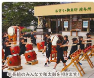
園長組のみんなで和太鼓を叩きます!

四季折々の楽しい行事、畑活動や和太鼓教室などの豊かな体験活動に裏打ちされた人間形成の基礎作りをめざす認定こども園。諏訪の子も通は、かわいい通園バスに表しているように、子犬のように元気よく猫のようにしなやかに、たくましくくすぐりと育っています。フワフワ・ニヤンニヤンバスも待っていますよ~!