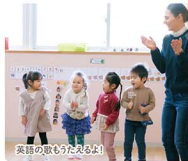
英語の歌もうたえよう!

山形県で唯一、英語を基盤とした保育園。現在、60名の子どもたちが通園しています。クラスに外国人教師と保育士の2名を配属し、目の行き届いた保育を行っています。英語はこれからの子どもたちには必須科目! 幼い時から、ネイティブの発音に慣れ親しみ、バイリンガルな子どもに育てます。