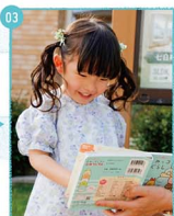
03 大好きなキャラクターを買ってニコニコ、本書もその調子でよろしくね。