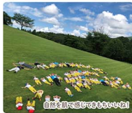
自然を肌で感じて楽しむ園庭

幼児期は自らの体を通しての感覚を育む時期。幼児期に芽吹いた感覚はその後の人生を鮮やかに彩り、そして知識は感覚を通してはじめて身に付きます。当園ではたくさんのいろいろな経験を積みながら、「たのしさを軸に、「元気で伸び伸び」育ちます。