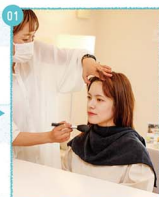
01 まずはママのメイクから。「ずっとこの日を楽しみにしていました」