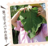
葉っぱでオハケのおも!