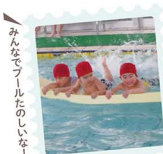
みんなプールしたのしな