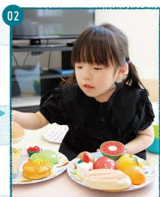
02 「ママの分もつっけてあげるね」りのちゃん特製アイツプレート完成だよ。