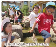
園庭に流れる小川で水遊びもできるよ!

「わたしがあなたがたを愛したように、あなたがたも互いに愛し合いなさい」(聖書)。木のぬもりあふれる園舎。地下水から湧く小川や泉と草花が咲きにおう園庭。その中で様々な事柄に出会い、心身が育っています。人間形成の基となる大切な幼児期を愛情豊かに育んでまいります。