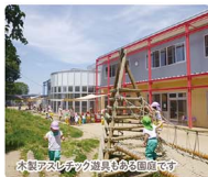
水遊びや水遊び道具もある園庭です

『認定こども園金井子ども園』に名称が変わり7年目。緑が多い園庭で園児たちは、虫や草花と友達になり、探求心や感性をはぐくみながら生き生きと遊んでいます。絵画・音楽活動、温水プールでの水遊びや体育・英語遊びを取り入れ、しなやかな身体と心を育てます。体験入園と説明会8月2日(水)。