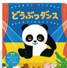
あかちゃんがよろこぶしかけ絵本シリーズ フルフルドローザ、あかちゃんみつけた、どうぶつダンス (ぼるぶ出版/935円)