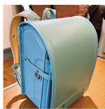
娘は、青は黒、女子は赤だったランドセル。今は色もデザインも豊富で、本当にうらやましい。自分の好きなものを選びださるって素晴らしい!

先日娘のラン活でお店へ。6年間飽きない色を選びますように…と願いながら、娘は赤や紫などを背負い替えること30分。「これ」と決めたのは、予想外のミントブルーのランドセルでした。自分で決めた色を背負うことが1番! と自分に言い聞かせつつ(?)、決まってお安心。来年春、無事に入学ですますように…ってまだ1年近く(先の話。ラン活、早速ぎっ!