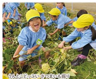
おとぎの国をさがそう園庭

赤い屋根の下をのぞいてください。み仏さまに見守られながらお母さん先生やお姉さんお兄さん先生と一緒に暮らしている子ども達の笑い声が聞こえますよ。本園は、いのちの大切さを伝え心身ともたたくまじい子どもの育成を目指しています。今年度(RS)10月より満3歳児クラスを開校予定です。