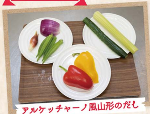
アルケッチャーノ風山形のだし