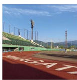
この日は夕方までスカッとした青空が広がっていて、爽快感がいっぱい。何もしていないけど、ビールがいつもよりうまかった(笑)

山形のベースボールスクールへおじゃましてきました。「よろしくおねがいます」と気持ちのいい挨拶をしてくれた子どもたち。白球を追い回す姿を見ているだけで、ふと目頭が熱くなってしまうのは私だけでしょうか。小さい頃か夢中になれるものがあるって素敵ですね。いつかここからプロ野球選手が誕生したりするのかな。陰ながら応援しているよ。みんなガンバレ!