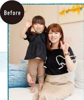
Before この日は今年の誕生日だったけど、元気にいっぱい登場!

今回は、ウンハウス平清水展示場にて表紙撮影を行いました。フレンチテイストのかわいらしいキッチンとリビングに、りのちゃんもママもうっとり。撮影の間は、大好きなすみっこらのことをたくさんスタッフに教えてくれました。「きょうはありがとうございました」と最後のこあいさつもパッチリ。暑い中での撮影、おつかいさまでした。