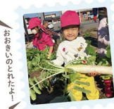
おどろきのとれたよ!