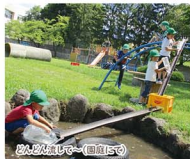
ぶらぶら遊んで(園庭で)

約6kmの広い園庭(公式戦サッカー場は7,140m 2 )でのびのびと遊ぶことができます。また、山形大学や他の附属学校と連携した活動も行われており、英語体験活動やiPadを使用した活動、SDGsと絡めた食育など、今話題になっているテーマにも取り組んでいます。未来を生きる子どもたちの支えとなる力を遊びを通して育みます。