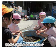
お花畑と自然の恵みで遊ぶ子どもたち

専修寺内にある園庭・園舎は豊富な緑に囲まれており、四季を通して楽しく遊べる環境にあります。仏教の教えにより、思いやりや優しさ、大切なことを学ぶとともに、「遊び」を通して創造的な思考や豊かな感性を養い、幼児期に大切なさまざまな経験や体験を通して、生きる力の基礎を培います。