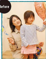
撮影前にママとパルーンおぼんさん。ピンクのハートがお気に入りみたい。