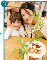
04. プレートを前に「仔り、この日一冊のスマイルを見せてくれました。