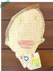
妹が描いたお兄様のポートレートに描き加えられたママの顔

たまたま吹き出しました。翌日「妹が「お兄ちゃんがイケメン」と言ってたよ」息子にそっと耳打ちすると、「は？ ぼくはイケメンじゃないよ」とそっけない態度。「実はママも思ってるよ」とたたみかけると、「君たちがそう思うなら、きつそうなのかもね」まさか過ぎる発言が飛び出しました。そんなキャラだっけ!? この質問をきっかけに「ママはどうしてパパと結婚したの?」と聞いてくるので、「ちなみにイケメンは誰と結婚するの?」と逆質問。すると、結婚に興味はないけど妹となら考えてもいいとのこと。なんじゃそりゃ。ちょっぴり大人びたドキッとする本音が聞けるわずかな時間。1分でも長く楽しみたいな。