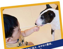
渾身の“どうぞ”に瞬間に高え、おかわり要求。 息子と犬への愛おしさが夜中中♡

これから、自分と家族の1日をつなぐこの場所で、我が家らしいシーンを撮っていけたらと思います。