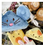
赤ちゃん向けのふわふわブロックですが、寝るだけでもかわいくって眺められる。最終的には寝か上げて喜んでしまう、撮影現場です。

毎回試行錯誤しながら制作に取り組んでいる「おやつ日和」。レシピはもちろん、背景の雑貨たちにもご注目なんです。今回はかわいい動物たちにおやつを見守ってもらう感じにしてみました。実はこのコーナー結構人気で、「マネてやってください」のお声も多かったです（みんなありがとう〜）パズ耳ラスクも、もちろん美味しく＆簡単に作れるので、親子でチャレンジしてみよう♪