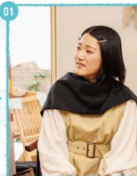
01. 帽子でこの日を飾りしみにしていたそう。どんな風に見えるかなドキドキ。