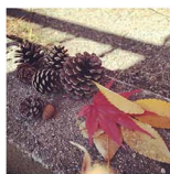
「もっと大きいのがいいな〜と、次人のほうが寝る時に夢中になっちゃうことも♪ スメの公園があればぜひ載せてください！」

公園に遊びに行くついで、落ち葉にどんぐり、まつぼっくりなど様々な「宝探し」が楽しめる季節が到来しました。道具がなくても遊べるって、なんて最高なんですよ！この時期にたくさん拾い集めておいて、クリスマス用のツリーやリースを親子で制作するのもgood♪ 今年で、「秋」が好きな季節ナンバー1に急浮上しつつある我が家です。皆さんは、どの季節が好きですか？