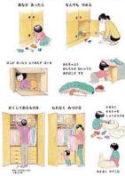
予測不可能な行動のオンパレード。かわいらしい“あるある”にほっこり。「いっさいはん」(岩崎書店)

今は中学生の娘さんがもう1歳半の頃に読めるなら、どんなことをしてあげたいですか？