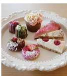
※写真はイメージです 【提供/caf  art】

山形城南町にオー プンしたバルーン カフェ。華やかな雰囲気 の店内では、こ だわりのプランチャや身 体に優しいデザート が楽しめます。その 日のおすずめのOと 皿で、心も弾む時間を 過ごしてみよう。デ ザートの内容はお任 せください。