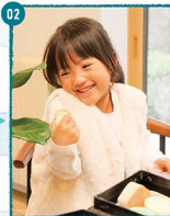
02. おしゃれが大好きなおすもちゃん。メイクボックスが世になる様子。