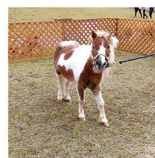
家前でロープウェイに乗って魔王へ、紅葉の盛りで観光客がいっぱい山々の美しさと久しぶりの静けさにほっと心地よくなりました。

夏前に家族が増えた我が家。5年前の赤やんにてんやわんやしているうちに気が付けば季節が2つも過ぎています。5歳の息子は早くも頭を悩ませています。母としては年末年始前にはやらねばならない山積みですが、夏と秋が劇く間に過ぎた分、今年の冬は楽しいことをたくさんしたいと思います。手始めにツリーを出そうかな？