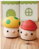
【提供/人をつなぐおもちゃ屋ふわり】

おもちゃコーデ ィネーターが選んだ 優しい木のおも ちゃ。ころころし たフォルムは、眺 めているだけで癒 されます。どんぐ りきのこなど、ど れが当たるかは 当日のお楽しみ し。