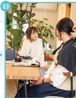
03. ママのメイク中。「友は私の髪ね。お髪短くなりたいな〜」とリエエスト。