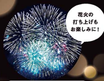
花火の打ち上げもお楽しみに！