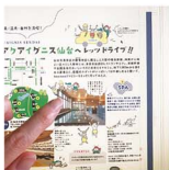
家族構成やキャラ不慮も、なんとなく自分の家族に似てくるから不思議。

とりあえず子育ても一段落した頃から、自分のキーワードを「身軽に、気軽に、テキトーに。」と、設定しました。そんな今の気持ちにリンクして先月にゆる〜くデビュー(?)したtocoTocoファミリー。今月は、レストランやカフェ。お買い物! 温泉! と魅力た〜っぶりな、アクアグニス山台へおでかけしてきました。まさに新緑の季節!! ドライヴがでたら家族で一緒にぜひおでかけしてみね。