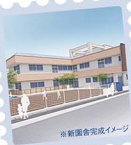
※新築舎完成イメージ

※令和5年度から、開園時期が変更になります。 詳細は入園説明会にてお知らせいたします。 未就園児の会 まっぴろけクラブ 「七夕まつり」7/6▶10:30~(受付10:10~) 「なつまつり楽しもう」8/4▶10:30~(受付10:10~) ▶予約制(事前にお電話等にてご連絡ください。)