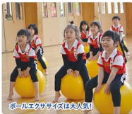
ボールエクササイズは人気!

ここで出会い、ここからはじまる。2歳・3歳・4歳・5歳、各年次毎の特色あるカリキュラムに基づき、年間を通して楽しい「体験学習」を積み重ねていきます。幼児期に育まれる「豊かな感情」や「知的な感性」の育成をめざし、充実した生活環境を整え、身近な自然環境に積極的にアプローチ。「昆虫の森創造プロジェクト」いよいよ始動!!