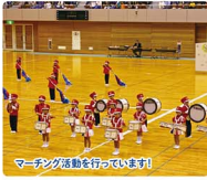
マーチング活動を行っています!

心身共に健康で誠実な子どもの育成を目指しています。広々とした園舎と園庭の中で、音楽教育と自然教育を重点目標にした保育を行っています。また、英語レッスンや希望者のバトンクラブ・体育教室があります。いつでも園の見学や子育て相談ができますので、ぜひお気軽にお問い合わせ下さい。