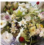
母の日一何もしなくても良いDAY、花の香りと家族のやさしさに包まれて、本当に何もせず過ごしました。そんな日があっても良い!

4月上旬。「お母さんの好きな花ってなに?」「好きな色って黄色で合ってるよね?」と、なぜか何度も質問してくる子どもたち。その謎が解けたのは5月8日、母の日のことでした。いつもありがと〜という言葉とともに、今までに見たことのない大きな花束を贈ってくれました。こちらこそ、いつもありがとう。去年は忘れられて(?)始まった記憶があったので、今年是最高な1日になりました。