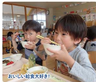
おいしい給食大好き!

東北文教大学のキャンパス内、新幹線が見える緑豊かな広々とした幼稚園。より良い人との関わりで、健康で意欲あふれる心豊かな子どもにも育ちます。預かり保育もあり、お母さんが安心して働ける環境も魅力の一つ。手作りでおいしい自園給食を食べて、様々な遊びやプール遊びを通して、主体性を育みます。