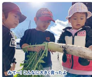
みて可愛いお野菜が育ったよ

米沢市中田町にあるキッズビーバルは、(協)米沢総合卸売センターの近くにあるアットホームな保育園です。お子様と保育者がじっくり向き合い、目の届く安全・安心な環境の中で伸び伸びとした1日を過ごしています。おむつ・おしりふきが月額扱い放題の「手ぶら登園」サービスも実施中です。