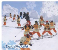
雪もスキーも大好き!

毎日が健康。毎日が笑い声。毎日が好奇心。少人数だから、子どもひとり一人の個性を引き出し、すぐすのびのびみんが大好き!になる心を育みます。プレスクールもありますので、見学はいつでもお子さんといっしょに遊びに来てみてください。お電話をお待ちしています。