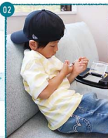
02. じっとと観察中、これはどんな種類かな？