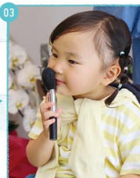
03. 「届いた、ボロボロ」メイクプランがすっかりお気に入りの様子。