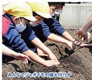
みんなが力を合わせて

出羽小学校の隣にある木材をたくさん使用した園です。山形市内一広い園舎・園庭という恵まれた環境を活用し、のびのびと主体的に活動しています。園内にはびっぴこ園地があり、野菜を育て、収穫し食の大切さを学んでいます。自園で調理したおいしい給食も子供達は大好きです。