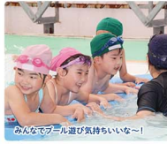
みんなでプール遊び気持ちいいな〜!

「心身ともに健康で心豊かな子どもの育成を目指して」を教育目標としています。重点教育「健康」では水泳による独自の幼児教育カリキュラムを、「自然科学」ではプログラミング教育を実施しています。子ども達が豊かな園生活を送れるよう心も体も裸で受け止めています。