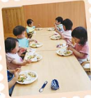
愛情いっぱいのお園給食

英語遊びや芸術活動など、様々な体験を行います。園内外の企業にお勧めの方だけでなく、米沢市内外問わず、どなたでも入所可能です。