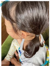
「髪が伸びたから、髪を結んであげたいな」と悩んで

しかも、根っから不器用な私。アレンジするにはそれなりの手間と気合と余裕が必要なんだけどな。口げんかしながらきゅっと雑に仕上げた日は、見えなくてどこでそとごみを外してきて、「なんかね、勝手にはずれちゃった」だった。この確信犯め! 年中さんになってから女の子同士の会話を少しずつ変わってきているようで、「むらさきで超かわいいよね!」「○○ちゃんのリボンがかわいいんだよ」と、かわいいを共有し合っている様子。ちなみに、自分の髪型が変わらなくなった日は、鏡の前でいろんな角度からチェック! 恐るべし女子パワー。かわいいを追求する日は、まだまだ続きそうです。