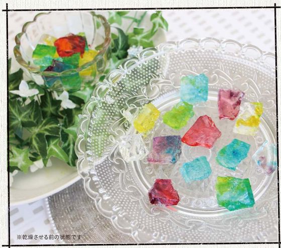
※乾燥させる前の状態です