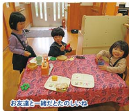
お友達と一緒にたのしいひととき

専称寺内にある園庭・園舎は豊富な緑に囲まれており、四季を通して楽しく遊べる環境にあります。仏教の教えにより、思いやりややさしさ、大切なことを学ぶとともに、「遊び」を通して創造的な思考や豊かな感性を養い、幼児期に大切なさまざまな経験や体験を通して、生きる力の基礎を培います。