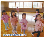
みんなで列車ごっこ!

保育と教育を共に提供できる英語や体操、屋内アール活動等を課内活動で行い、日常の教育活動、園の畑活動、行事等と併せて体験学習を通して子どもの情操を養い、豊かな感性と生きる力を育みます。また、希望者は通園しながらカワイイ体操・音楽・造形教室やECC英語教室を受けることも可能です。