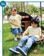
04. 撮影の合間、プラン中のんびり休憩タイム、もうひと息がほしいらうね。