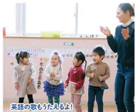
英語の歌もうたえるよ!

山形県で唯一、英語を基盤とした保育園。現在、60名の子どもたちが通園しています。クラスに外国人教師と保育士の2名を配属し、目の行き届いた保育を行っています。英語はこれからの子どもたちには必須教育! 幼い時から、ネイティブの発音に慣れ親しみ、バイリンガルな子どもに育てます。