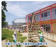
木製アスレチックが楽しめる園庭です。

『認定こども園金井こども園』に名称が変わり6年目。緑が多い園庭で園児たちは、虫や草花と友達になり、探求心や感性をばくみながら生き生きと遊んでいます。絵画・音楽活動、温水プールでの水遊びや体育・英語遊びを取り入れ、しなやかな身体と心を育てます。体験入園と説明会8月3日(水)。