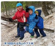
年3回訪れる月山のブナ林

赤い屋根の下をのぞいてください。み仏さまに見守られながらお母さん先生やお姉さんお兄さん先生と一緒に暮らしている子ども達の笑い声が聞こえますよ。本園は、いのちの大切さを伝え心身ともにたくましい子どもの育成を目指しています。認定こども園になり、月かげ家族の物語が新たに始まりました。