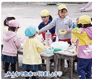
みんなが力を合わせて

「強く・明るく・仲良く」を目標に掲げ、豊かな自然環境の中で元気に遊び、お茶会などで思いやりの心を学びながら、動と静の豊かな活動を通して、たくましくやさしさを培っています。令和5年4月、山形市松波3丁目に移転し、0歳から受入可能な幼保連携型認定こども園として開園予定です。