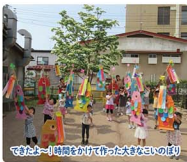
毎日1時間園を行って作った大きな木の切

「わたしがあなたがたを愛したように、あなたがたも互いに愛し合えないさ!」(聖書)。木のぬくもりあふれる園舎。地下水から流れる小川や泉と草花が咲きにおう園庭。その中で様々な事柄に出会い、心身が育っていきます。人間形成の基となる大切な幼児期を愛情豊かに育んでまいります。