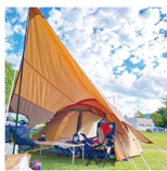
去年1回しか行けなかったキャンプ。ちなみに、おととしは大雨の中のキャンプも経験しました。今年は何回行けるかな~。

キャンプデビューを果たしてから3年。天候&子どもとの体調に左右されやすいのでなかなか回数はこなせていないけど、やっぱり外で過ごす時間は格別。今回取材でご邪魔したグランピングも、3年前にオープンしていたら絶対に予約していたと思うほどステキすぎました。だって、テントも食事の準備もいらないなんて、ママにとって天国ではないか！