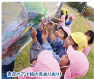
青空の下で絵の具もりぬり!

ものごとを探求しようとする心=好奇心。人間形成の土台となる幼児期だからこそ、心を大切に育てます。アート&デザインの刺激いっぱいある芸工大・多様なコミュニティ・豊かな自然・これらの環境が特徴です。様々な経験を重ねながら、これからの時代を生き抜く強さ、しなやかさが育ちます。