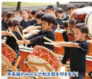
年長組のみなさんと和太鼓を叩きまわす!

四季折々の楽しい行事、畑活動や和太鼓教室などの豊かな体験活動に裏打ちされた人間形成の基礎作りをめざす認定こども園。諏訪の子ども達は、かわいいうるすい園バスに表しているように、子女のように元氣よく猫のようにしなやかに、たくましくすくすくと育てています。フワフワニヤンニヤンバスも待ってるよー!