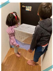
野菜が苦手な息子の野菜を食べてもらうために、お母さんが野菜を美味しく調理してあげています。

食材は毎日届くので、苦手な野菜が入っている日はカレーやお好み焼きにメニューを変更することになります。でも、形を変えても野菜は野菜。テーブルに並べるとコレジャナイという顔をされる訳です。ついに先日は、「こんなイヤだ」と息子にはっきりと口をきいてしまい、「だったら食べるな! もうごはん作らないからね」と大人が怒りました。笑顔溢れる楽しい食卓、栄養バランスの取れた食事は理想だけど、レシピを考案出すのはと苦勞。ああ、これからは毎日続いでいく無限ループ。どうか研究に没頭する学者の皆さま。レシピ作りで頭を悩ます私たちがおスキリするような法則を見つけたしてよー!!