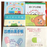
「夜中に熱を出して救急に相談した日」「暑がひどくて入眠した日」と、子どもたちの暑熱症ストーリーが満載! 手帳、なんでも使える! のよねね。