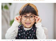
めがねはワクワクのともだち