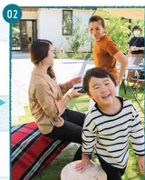
02.今日は鏡子で決まってるね。声をかけられてママの緊張もほどけたみたい。