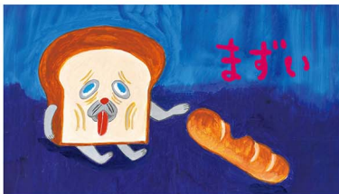
「世界一おいしい森のパン屋」から、頂戴してきたパンを食べると〜こんな表情になっちゃった〜!! このあと物語はどんな展開になるか、読んでのお楽しみ♪

キャラ設定で編集者と話しているのが完璧な泥濘じゃない方がよいという。子どもが「自分がパンどろぼうにならう〜みたたい〜楽しんでパンどろぼうが私の手を離れて子どもたちの想像の中で動こうかなヤラター〜」になっ〜一番いいな思っています。子どもも大人も泥濘じゃないよに、主人公もよくも悪くも、失敗もする。うまくいかないでいいことある。そういう味を出して〜ストーリーはあるという展開になりました。