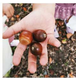
公園で秋を拝しました。子どもに負けにくい、私もたくさん遊べました。ついつい夢中になってしまいます。

やってきました食欲の秋。万年秋エーターの私にとっては悩ましい季節。芋煮に栗ご飯、焼き芋、新米...おいしいものばかりあれ? でも春は山菜、夏は山形牛でバーベキュー、冬は寒糖汁。山形に住んでいるとダイエツをする暇なときないのでは? おいしいものに囲まれた生活、幸せです。山形在住で良かった! さあ、パン特集で取材したお店にもさっそく買いに行こう!