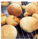
即席でもできるパンフレシ。取材時に早速撮影してみました。水分の計量が選んだたせいで、たたく生地一つでも美味しく焼きあがったよ!

大好きな絵本「パンどろぼう」の作者柴田ケイコさんにお話を伺った今回。大ヒット作の作者さんなのに、謙虚で丁寧にたくさんのお話を聞かせてくださって、ますます大好きになりました。パンの魅力や存分にお伝えできた今回のパン特集。読んで食べて作って、みなさん楽しみ尽くしてくださいね! パンどろぼうグッズが当たるインスタ投稿企画もご応募お待ちしております!