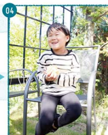
04.「いただきます〜」、メロンパンをべロりと完食。お味はいかが?