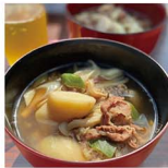
私に包丁にちぎった商標も美味しく付けしてもらったので、なんか良い感じに褒められました。お料理さんでござい〜!

先日、社内で芋煮会がありました。調理班としてお手伝いをしていただきましたが、料理が下手な私。ネギを切る様子を見ていた課長から「包丁を持つつぎが危ないと言ったので、両手をちぢぎ、キコむをしましする係に任せられました。家で料理はするのですが、自己流なので包丁の使い方も調理の下ごしらえもよくわかってない。これは料理教室に行くべきなのかも。検討中です。」