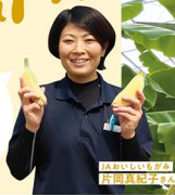
丹精込めて作ったバナナ 丹沢村産バナナ

丹精込めて作ったバナナはどれも我が子のようにかわいくて私が好きな品種はアールバナナ。ゼロー環境ってみてくださーい