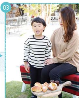
03.撮影直前。美味しそうなんが並んでいるけど、ちょっとだけガマンしてね。