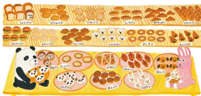
たくさん並んだパンはどれもかわいくて美味しそうで、選べない!! どこにパンどろぼうがかくれているよ。見つけられるかな?

「作品について聞いてみたい。」 全部お話ししたいわい。 おいしいパンが出てくる世界じゃないとパンどろぼうに住む理由がなくなっちゃうから、かなり気を付けてお話しが伝わるように描きました。ふくらみ飛んでいる感じをどうやって出すか、色付けは高めてみました。