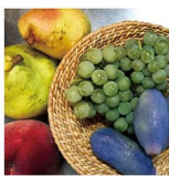
いよいよ夏物盛りだくさんの季節がやってきますね! 今年は特集下巻のフルーツのヒミツを参考に遊びたいと思います。

余ったりんごはいつも甘いコンポート派だったけれど、去年、塩だてで煮るコンポートを知り、そのさっぱりした味にハマりました。そして今回は新たに、調味料にもなる塩りんごを使った料理にtry! 豚肉との相性もバツリで肉にもは乗かくなる旨味も増してとってもおいしかったです♡ ぜひ作ってみてください! 今年はめずらしく夏バテもせず、このまま食欲の秋に突入りしそうな予感…。