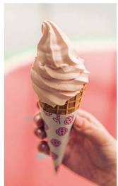
● スイカソフトクリーム 320円