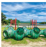
鹿尾花沢の公園に「流石! おばね、っていう漢字を流しこんで、7月にしてはもなぞおばね、って呼ぶんだらうわ〜。

ちい鹿尾花沢欄を取材した日は「これでもかっ!」と言うくらい、夏を絵に描いたような「超超夏日」。吹き出す汗と格闘しつつ、ステキスポットを巡って来ましたよ。スイカ生産量の8割というスイカの産地でもある鹿尾花沢。盆地特有の寒暖差と栄養豊富な土壌で育ったスイカは、それはそれは甘くてジュシーだよな。「嗚呼〜夏」って感じ。子ども達のこぶりつ姿は、カブトムシそのもの。