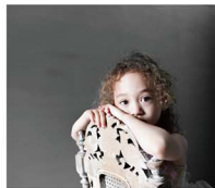
photo studio cocoé フォトスタジオ ココエ