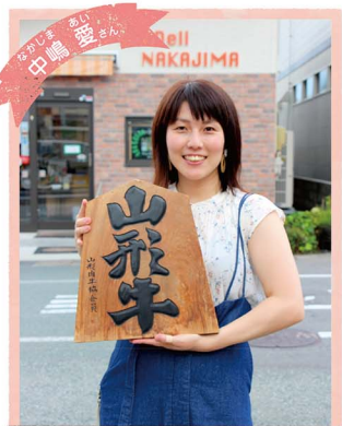
愛知県名古屋市出身。大学在学中、保健体育の教員免許を取得し、大学時代に出会った夫と結婚。妊娠を機に2017年山形市に転居。夫が経営する(株)中島商店の広報を担当。山形市在住。

3人の育児をしながら、子育ての楽しさと夫が営む精肉店の魅力をSNSで発信し続けるママをご紹介します。