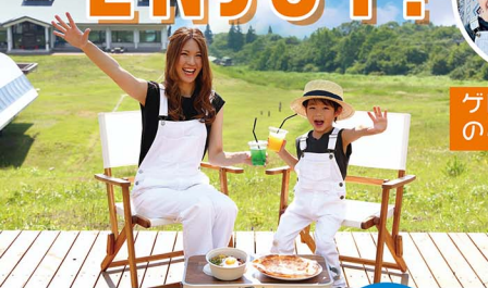
▲椅子2脚+テーブル1台レンタル 1,000円/1日

上山市蔵王坊平高原にある蔵王ライザワールド。グレンデからの開放的な眺め、親子で楽しめる美味しいピザ、リフトでの天空散歩と、ファミリーが楽しめる魅力いっぱい!! 夏ならではの蔵王ライザワールドの楽しみ方をどうぞご紹介しちゃいます。