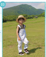
03. 準備完了! ゲンデの上にあるウッドデッキまで、よーいドン!