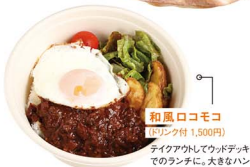
和風ココモコ (Lサイズ付 1,500円)