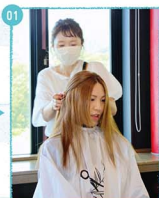
01. ママの長い髪をさかしくつ、貴やかねヘアスタイにしてしまおうか〜。