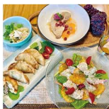
撮影日に全編集者、個人的にオススメしたいのが、柿のルパッチョとズリコンゴ。どちらもほどほど美味しいと感じるので、ワンスはもういっしょ!

アンデルセンサウンド派のわが家。「果物を料理に使うの?」と冷やかな視線を感じながら作ったDELiの飯々。念のため、フルーツが入っていないバージョンも作って食卓に並べたところ、「入っている方がおいしい」と予想外のコメントに思わずガッパズ。特に、マヨネーズと梨の組み合わせが気に入ったようで、子どもたちからは「もっと食べたい」とリクエストされましたよ。