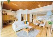
▲使い方の自由のフリーリビング