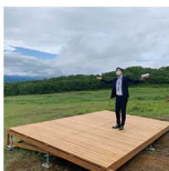
蔵王ライザのウッドデッキ、広くて撮影的で、一瞬に撮影の下見に行ったスタッフのほけつさん、マヨネーズと梨で。

毎日あつてはすね…。夏に快過レジャーを楽しむのにオススメなのが蔵王です。表紙の撮影＆記事ページでも取材させていただいた蔵王ライザワールド。スキのイメージが強かったけど、夏も最もしゃんぱんに設置されたウッドデッキで「ファアッ!」ってなるのがたまらぬ。ロケットに迫ったりお釜までつたり、オプションもたっぷり。山形市内からでもアクセス便利なお蔵王で夏を楽しもう♡