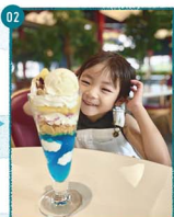
02. ライザワールドで人気の「天空パフェ」。美味しそうでついつい笑顔に。