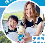
半澤璃心く(4) 星香マ

上山市蔵王坊平高原にある蔵王ライザワールド。グレンデからの開放的な眺め、親子で楽しめる美味しいピザ、リフトでの天空散歩と、ファミリーが楽しめる魅力いっぱい!! 夏ならではの蔵王ライザワールドの楽しみ方をどうぞご紹介しちゃいます。