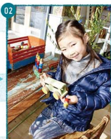
02. お店の木のおもちゃがレトロでカワイイ♡