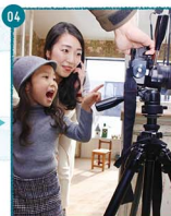
04. メラチューク!! かわいい笑顔を見せてくれてありがとう。