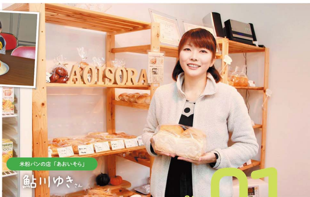
米粉パンの店「あおいそら」