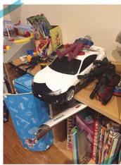
1978年10月25日生まれ。5歳。幼稚園に通う娘(3歳)の子育て真っ最中。

最近ではイライラすると、「何か好きなもので買って」と貯金箱から500円玉を出したり、週末になると「明日はお庭坊でできるし、ビールでも飲んじゃえ!」と母の取扱いを心得てきている子どもたち。年齢的にはますます左右されているのだからうけど、2人の大切な命を育ててくれたワケでもあるし、もう少しこの極悪怪獣と上手く付き合っていかなきゃ。