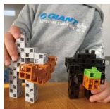
家にあるブロックでキャラクターを組み立てたり、アイテムを作ったり、リアルの世界でも楽しんでいます!!

小学生に絶大な人気があるマイクラ(Minecraft)にハマり中の息子。ゲームはもちろん、TVの時間を削ってまでマイクラの動画を見たり、頭の中はこれしかないのか?と言うくらい、寝て起きてでもマイクラのことがばり(笑)。息子が始める前にもどんなものかと私も試しにやってみましたが、面白さが今ひとつ分かって...今、そこで情報を仕入れてくれる?と呆れるくらい詳しくなって、もうママはその話題についていきません!