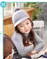
03. さまで紗瑛ちゃんのお支度も完了! リップを塗って買ってココロこねね。