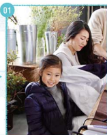
01. 只今ママのヘアメイク中...ママの指でおりがみ遊び、お絵かきとって上手!