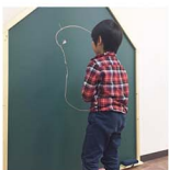
黒板消しを見つけて「これスリッパ?」と言った子どもに、ジェネレーションギャップを感じずにいられます。

習い事特集でご紹介した「アトリエスマイル」さんへ、子どもたちとおじゃましてきました。背丈よりも大きい黒板、色とりどりのチョーク。不思議なオブジェの数々に親子で大興奮。何より「好きにやってみよう」「汚してもいいよ」の言葉に、子どもの創造力スイッチもON。水泳? 英語? お絵かき? 家とは違う環境だからこそ伸びる力があると信じて、特集を熟読せねば!