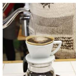
震災企画で取材させていただいたコーヒー豆専門店を訪ねていただいた一杯。日常への感謝を忘れずにたいです。

東日本大震災が起きた10年前、私は西日本に住んでいたのですが地震発生には気づかず、友人からの「山形の実家大丈夫?」というメールで知りました。その後TVから流れてくる映像に目を凝らし、被害の大きさに茫然とした記憶があります。10年が経とうとする今、家族と当たり前に過ごす毎日が決して当たり前ではないこと、災害への備えの大切さを改めて胸に刻みたいと思っています。